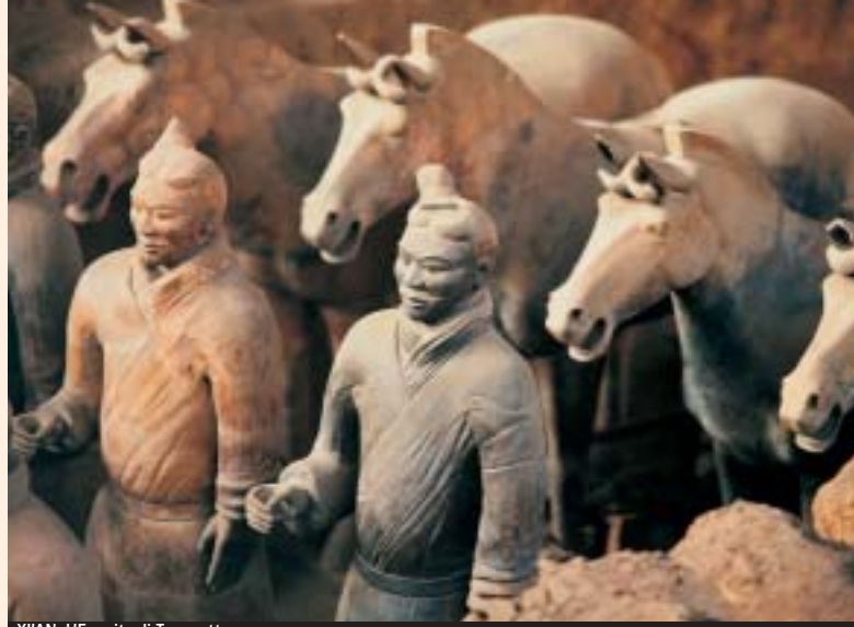
XI'AN, L'Esercito di Terracotta

Prima colazione in albergo. Trasferimento all'aeroporto e partenza per l'Italia con volo di linea. Pasti, rinfreschi e pernottamento a bordo. Arrivo in Italia e fine dei servizi.