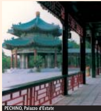
PECHINO, Palazzo d'Estate