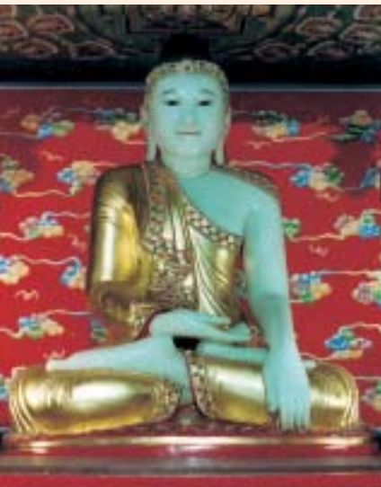
PECHINO, Buddha di Giada (Città Rotonda)