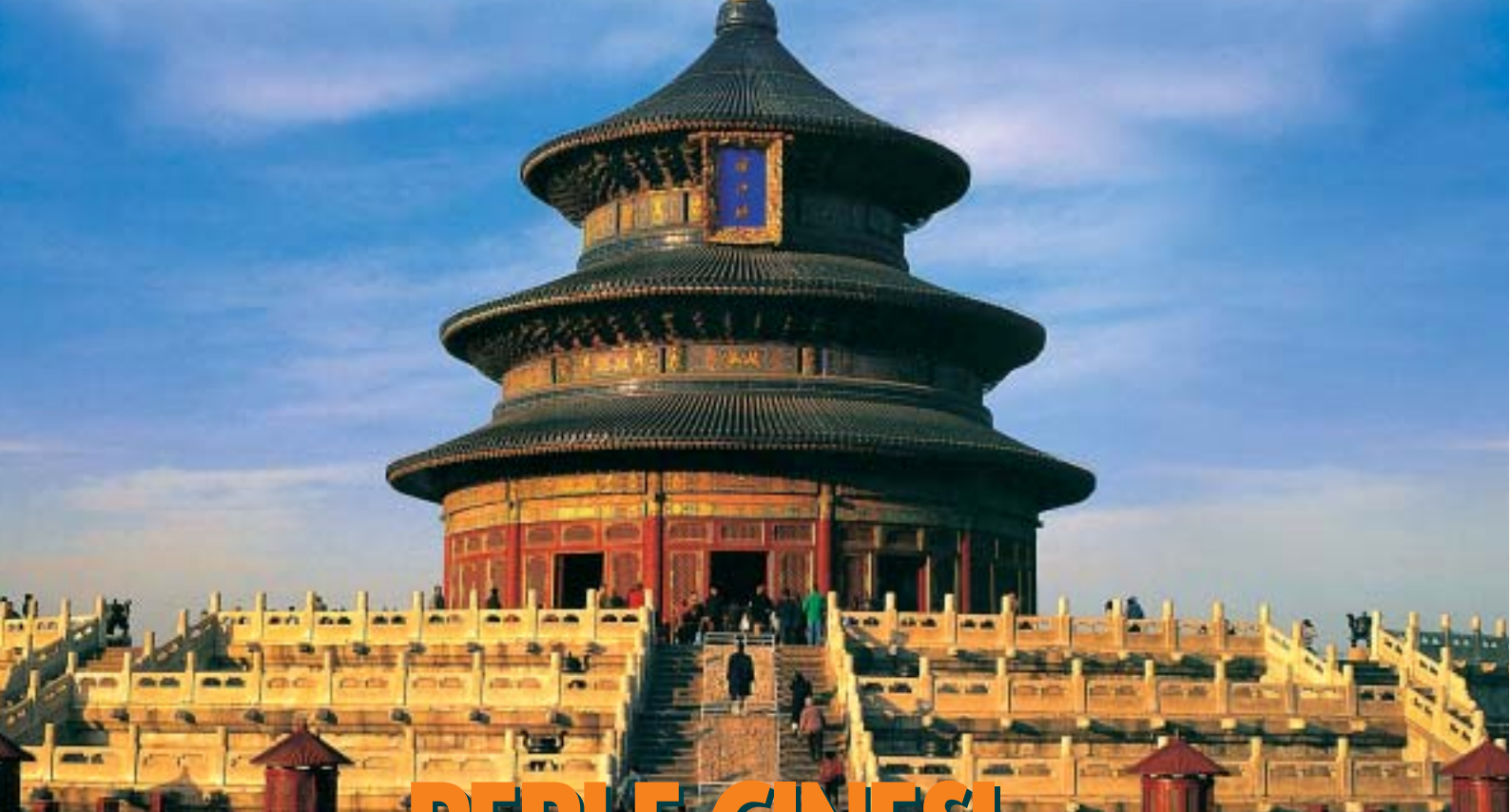
PECHINO, Il Tempio del Cielo